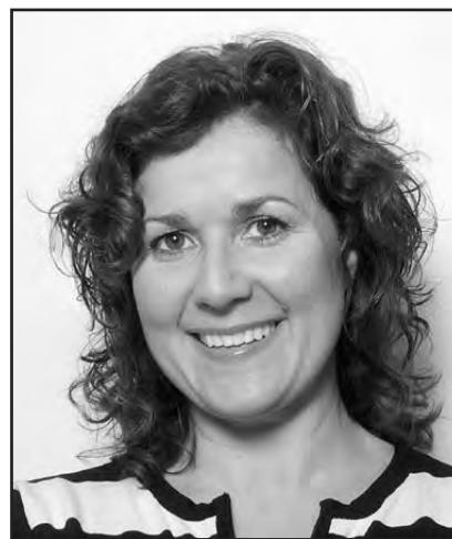
Kollega med et betraktelig strammere formverk. Et eksempel til etterfølgelse for slappe NRK- og TV2-folk!