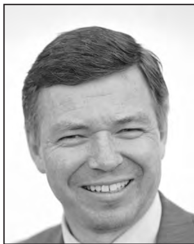
Eksempel på person med et illelydende, noe formløst, dog relativt konsekvent, formverk. Men er det Gud eller Mammon som skal bebreides?